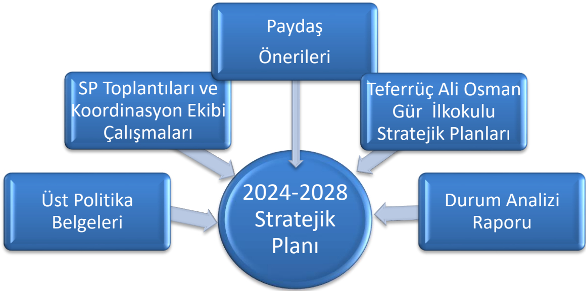
Şekil1: Teferrüç Ali Osman Gür İlkokulu Stratejik Planlama Süreci